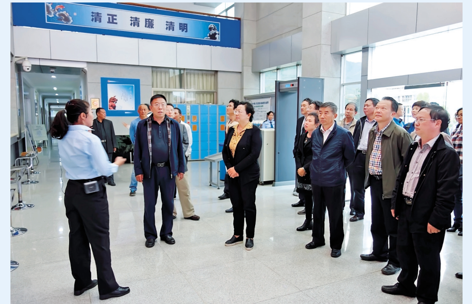
市人大常委会组成人员到市中级人民法院视察工作