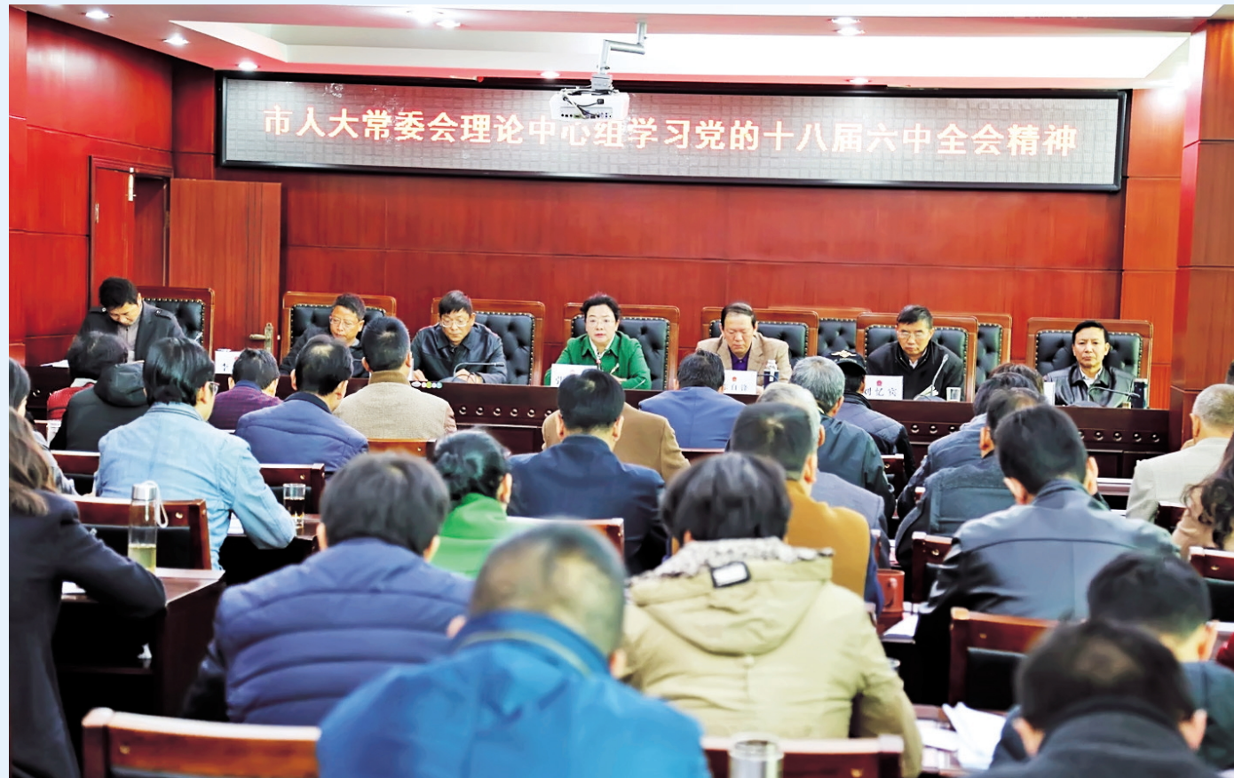
市人大常委会以多种形式,多次组织学习党的十八届六中全会精神。