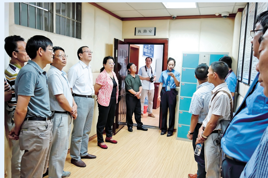
市人大常委会组成人员到市人民检察院视察工作