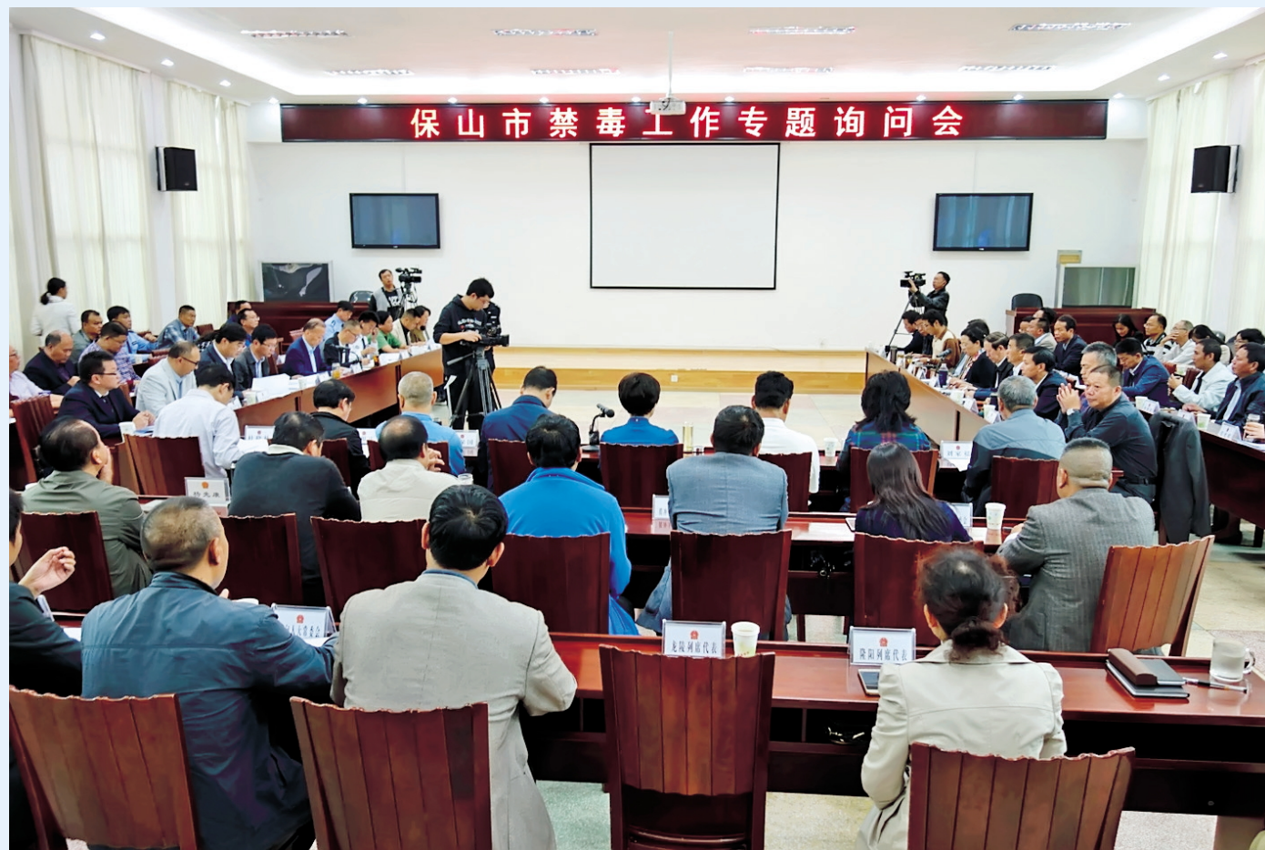
市人大常委会组织对全市禁毒工作进行专题询问