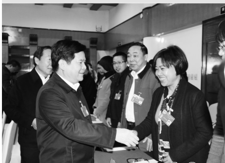
云南省保山市人大常委会 主办 2015年第 1、2 期 (总第 41、42 期)