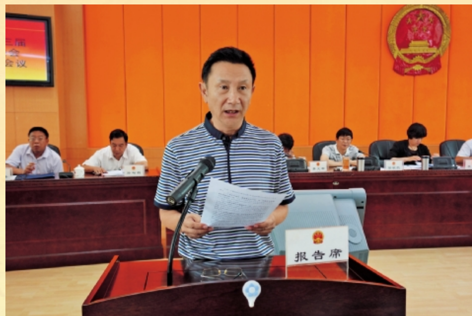
市人大常委会秘书长 耿卫民宣读有关材料