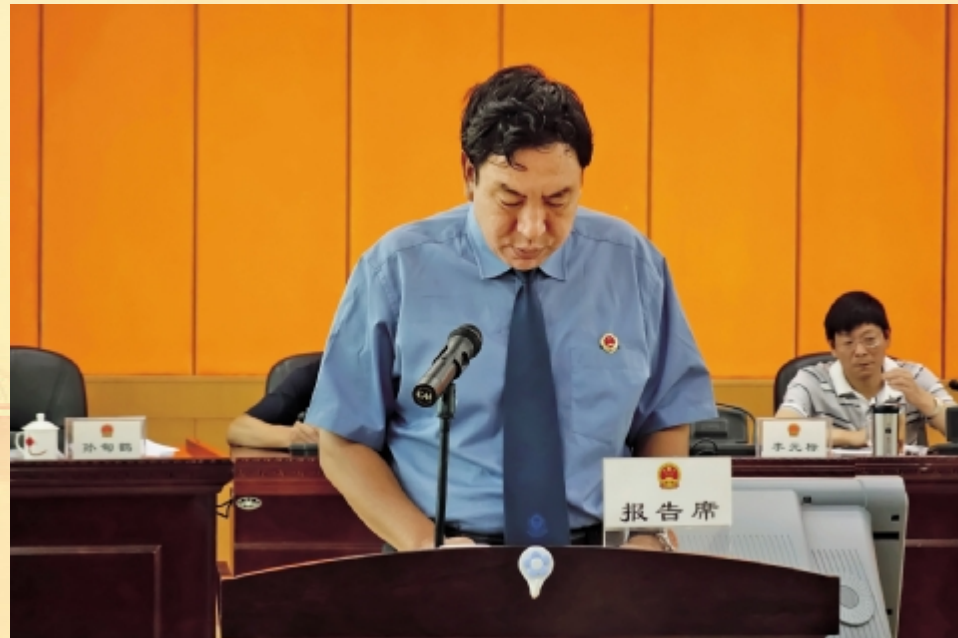
市检察院检察长孙甸鹤作报告