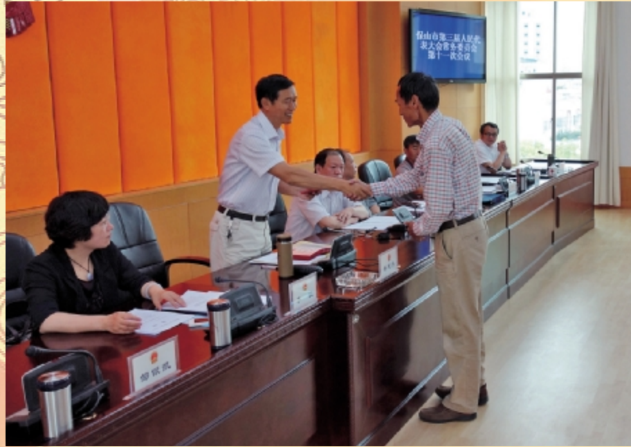
市人大常委会主任 杨建洪颁发任命书